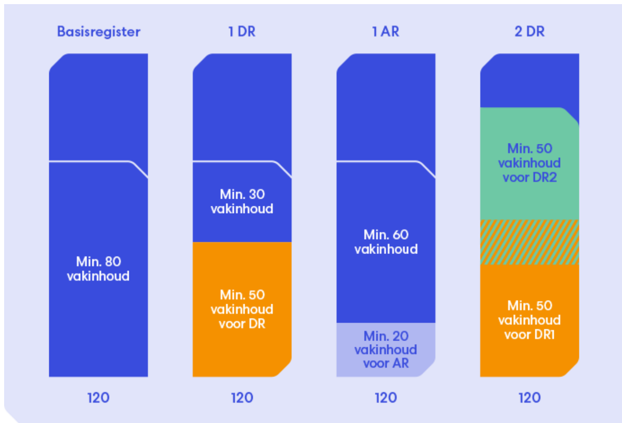
Figuur 3 Vier situaties van registratie