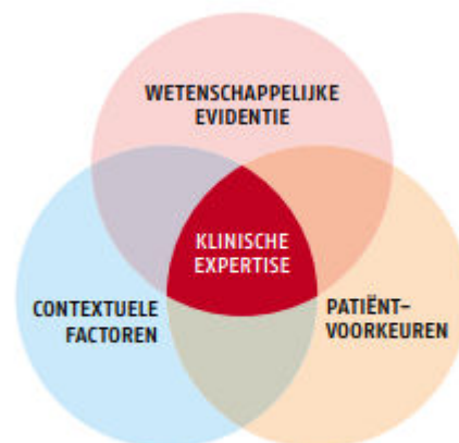
Figuur 1 Principes van evidence-based practice